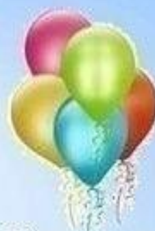
Пять воздушных шаров